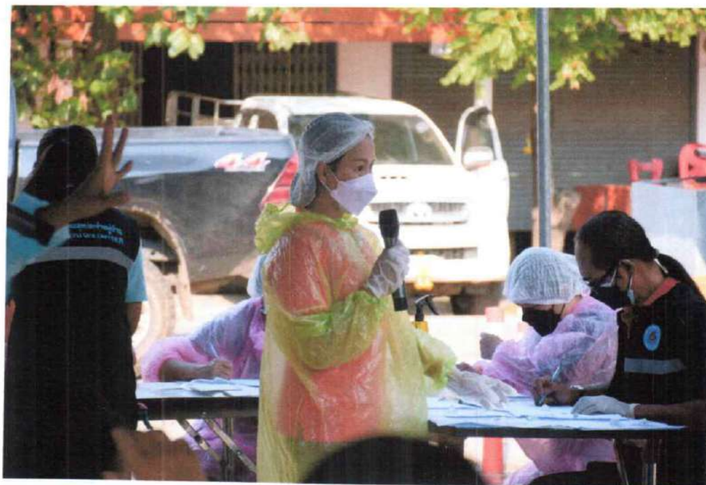
ประชาสัมพันธ์ให้ความรู้ประชาชนผู้เข้ารับบริการ