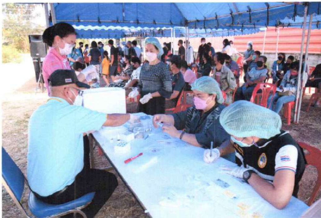
มอบชุดอุปกรณ์การตรวจให้กับผู้รับบริการ