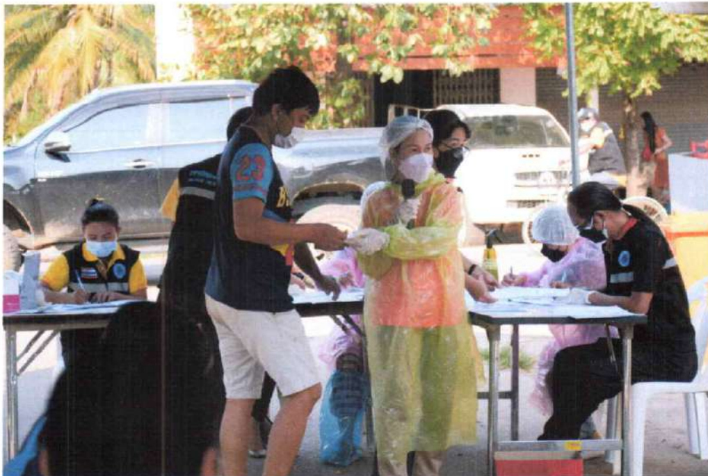
มอบชุดตรวจให้กับผู้มารับบริการ