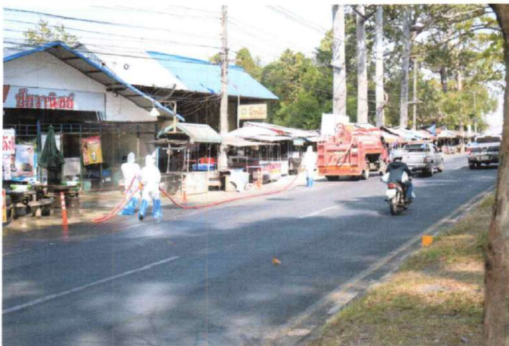
เจ้าหน้าที่ อบต. หัวเรือ ฉีดพ่นฆ่าเชื้อป้องกันและควบคุมการระบาดของโรคติดเชื้อไวรัสโคโรนา ๒๐๑๙ หรือโควิด ๑๙ เพื่อความปลอดภัยของผู้ประกอบการและผู้ที่มาจับจ่าย